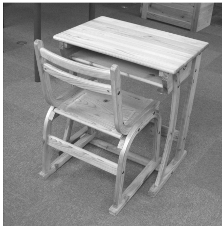
(出所) 筆者撮影, 2009年7月16日。

あり, それぞれ身長に合わせた高さ調節が可能であること(高さ調節用ゲタを取り付けることによって机は3cmごと, 椅子は2cmごとの調節が可能である), 第2に従来の木製机に比較して大幅に軽量化されており, 小学校低学年用の椅子で約2.3kgと, 低学年の児童でも持ち運びが容易であること, 第3にJIS(S-1021)規格の繰り返し耐衝撃テストに合格しており, 耐久性・強度の点ではスチール製と比べて遜色がないこと(同じ机を10年以上使用している学校もある), 第4に破損したり, 天板にキズがついたりした場合でも部品単位で交換ができること, 第5に塗料や接着剤もすべて身体に無害のものを使用していること, 第6に「グリーン購入法(国等による環境物品等の調達に関する法律, 2000年成立)」のグリーン購